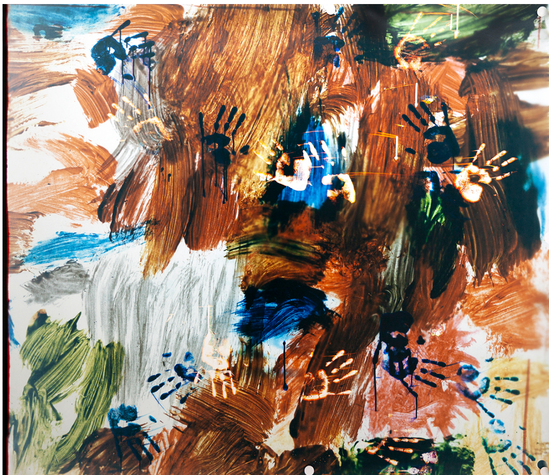
XXe siècle - Premier tirage chromogène d'une série en devenir.