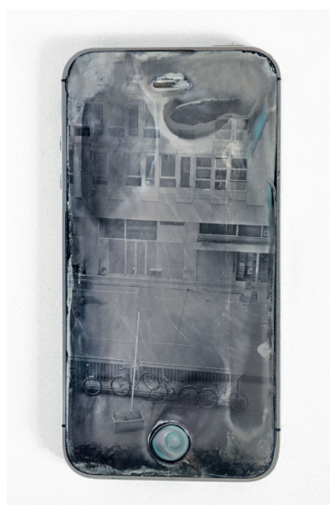
Implosion K Rochester (2022) - Impression UV, smartphones (modèle Iphone 5) - Œuvre simulée numériquement à gauche / Test réalisé avec une technique au collision sur Iphones 4 à droite © Lucas Leffler