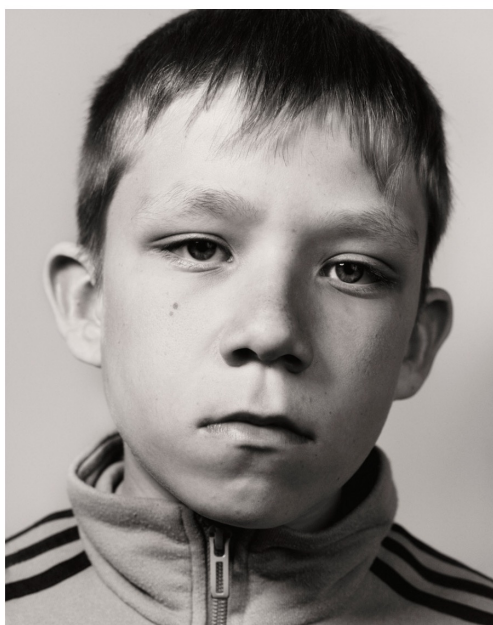
Teenage Portraits, lauréat du prix Picto de la Photographie de mode 2026