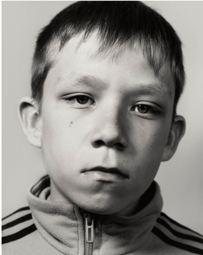
© Jérémie Monnier, dotation Filippo Roversi 2026

Teenage Portraits documente les adolescents du collège Évariste Galois à Breteuil-sur-Iton, village isolé de Normandie. L'artiste, originaire de la région, observe une jeunesse marquée par l'éloignement et la précarité, qu'il raconte à travers visages et styles.