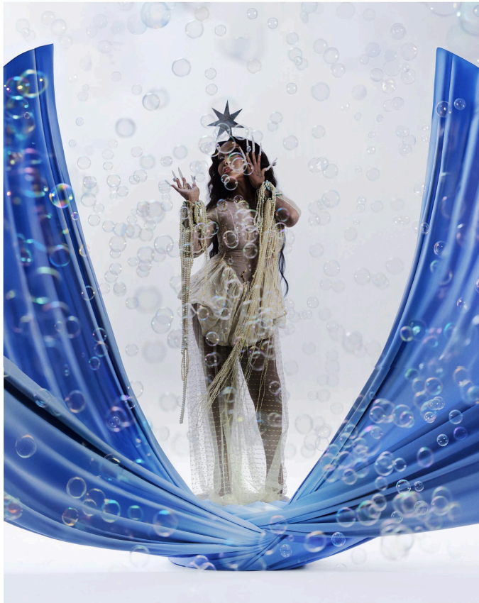
© Ode, dotation LGA Management / Janvier 2026

Les carrancas sont des sculptures aux traits anthropomorphes et zoomorphes, au visage souvent rude, destinées à éloigner les mauvais esprits. Elles symbolisent également les religions afro-brésiliennes, comme le Candomblé, liées à Exu, orisha médiateur entre le monde matériel et spirituel, associé au mouvement et à la création de possibles. Pour ce projet, l'inspiration vient de l'Égypte ancienne et de la culture Yoruba, non pour leur origine afro-diasporique, mais parce que la physiognomie des carrancas mêle traits humains et animaux, comme les dieux pré-dynastiques égyptiens.