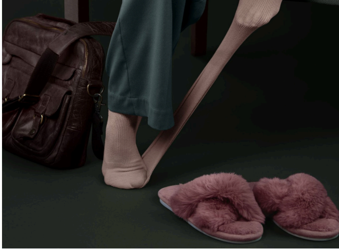
© Marie Blampain / Grand Prix Picto de la Photographie de Mode 2026