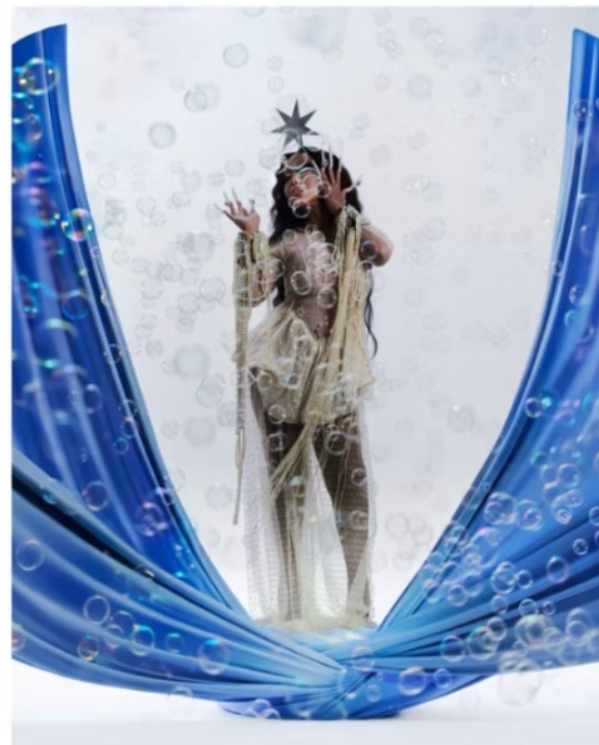
Prix LGA Management / Janvier 2026 Credits: Ode

Ode est une artiste brésilienne pluridisciplinaire. Sa série Carranca fait référence aux carrancas, des sculptures traditionnelles brésiliennes ou afro-brésiliennes aux traits humains et animaux, historiquement utilisées pour éloigner les mauvais esprits. Gains : séances de retouche/postproduction.